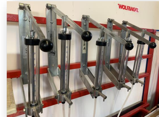
Wanddosiergeräte Edelstahl, ohne Anschlag